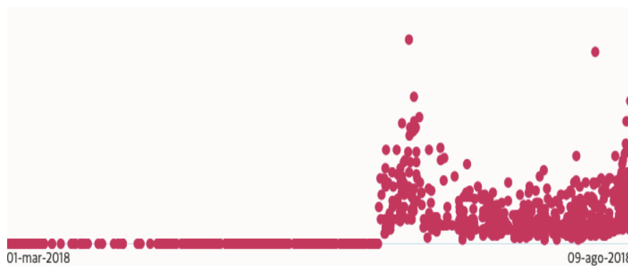
Figura 1: Engagement